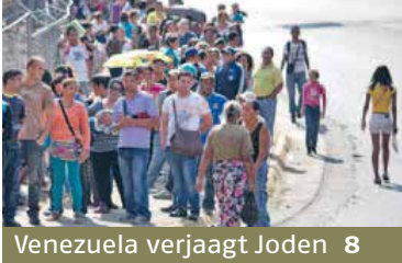
Venezuela verjaagt Joden 8

JAARGANG 72 NR. 19.348 WWW.ND.NL REDACTIE@ND.NL 0342 411 711 CHRISTELIJK BETROKKEN