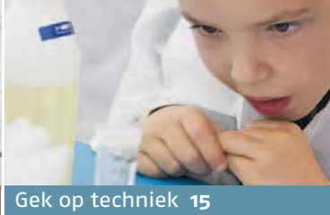
Gek op techniek 15